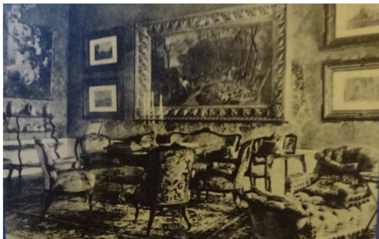
17. kép Budavári Erzsébet Királyné Emlékmúzeum, jobboldalt a királyné nyugágya, 1868

A gödöllői Grassalkovich-kastély „Az én Sisim” időszak kiállításában megtalálható egy fotó, amelynek felirata a következő: „Erzsébet királyné dolgozószobája a budavári Erzsébet Királyné Emlékmúzeumban: Jobboldalt a királyné nyugágya, amelyen 1868-ban Budapestre utazott”. A nyugágy nem túl jól látható a képen, de azt biztosan tudjuk, hogy tűzött, háttámlája magasabb, van karfája, illetve a lábrésznél a támla alacsonyabb. (17. kép)