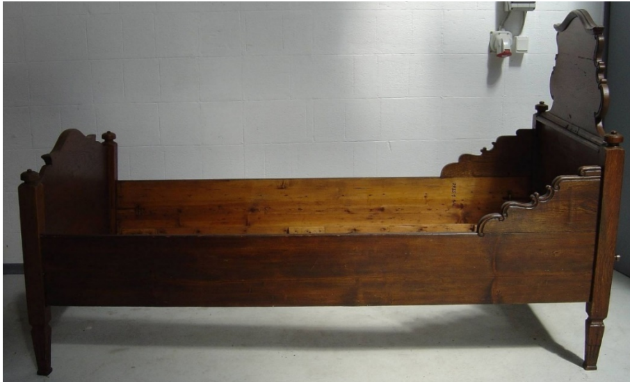
4. kép Szabadtéri Néprajzi Múzeum, koraklasszicista ágy, Észak Magyarország, 18. század vége

Stílusában a legutóbbi példához hasonlít – rokokó vonalvezetésű a támladísztésekkel és a klasszicista vékonyodó lábakkal – az Iparművészeti múzeum koraklasszicista gyermekágya a 18. század végéről. 54 (5. kép)