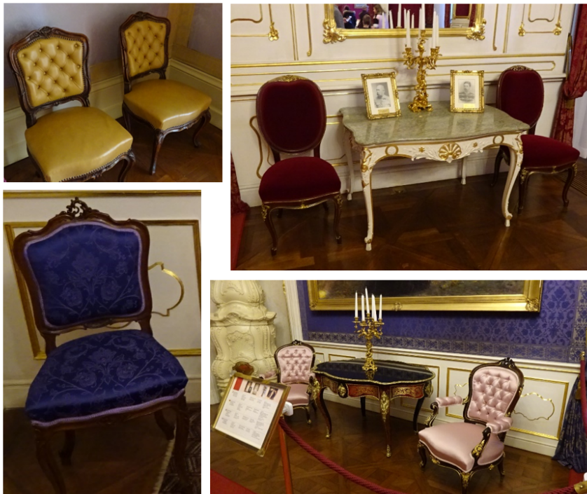
54. kép Gödöllői Grassalkovich-kastély, szalon székek, 19. század 2. fele

A gödöllői Grassalkovich-kastély kiállítás enteriőrjeiben számos példát láthatunk a 19. század közepéről, második feléről. (54-55. kép.)