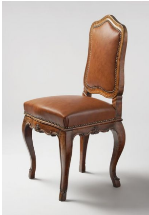
42. kép Iparművészeti Múzeum, barokk stílusú szék, Magyarország, 18. század közepe