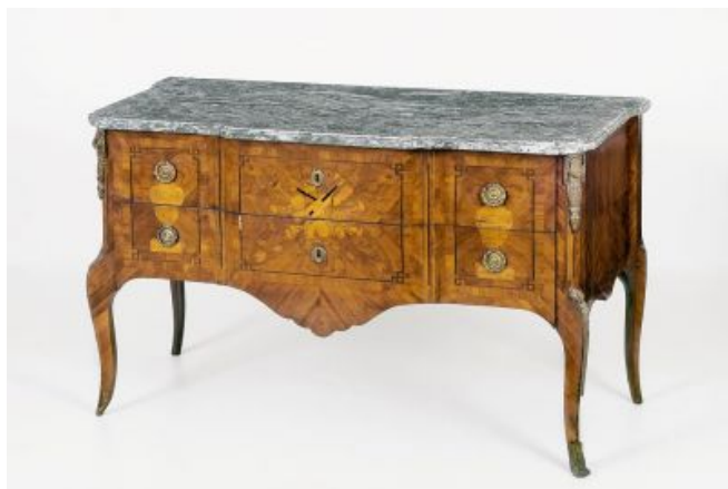
32. kép Iparművészeti Múzeum, Pierre Roussel komódja, Budapest, 1760

Természetesen az Iparművészeti Múzeum többféle stílusú komódot őriz az elmúlt századokból. A 18. század második feléből egy Magyarországon készített bronz veretes, diófa komódot emelek ki, mely egyszerűségében gyönyörű. (33. kép) Feltehetőleg nem szalonba való komód, talán inkább éppen vendégszobába. 83 A következő a 19. század elejéről egy diófa borítású, berakásos komód, amely az előzőtől több szempontból is teljesen eltér. 84 (34. kép) Az utolsó példám pedig a 19. század második feléből való, Közép-Európából, a historizmus korából. 85 (35. kép)