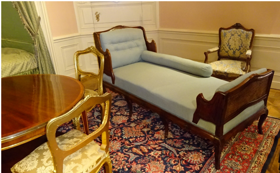
19. kép Tatai Eszterházy-kastély, hálószoba, 20. század eleje (saját fotó)

A tatai Eszterházy-kastélyban újra berendezett két hálószoba-entériőr mindegyikében található pihenőágyakat. (19-20. kép)