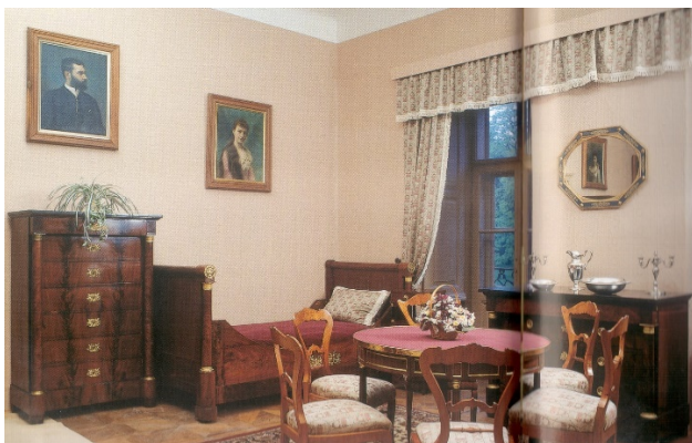
16. kép Betléri Andrassy-kastély, biedermeier szalon, 19-20. század fordulóját reprezentálja