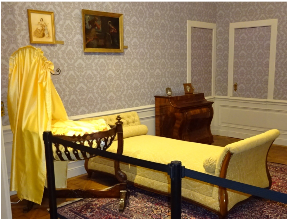
20. kép Tatai Eszterházy-kastély, hálószoba, 20. század eleje

Somlai Tibor a „Volt és nincs” című kötetében olyan fotókat publikál a 20. század első feléből, amelyek az egykori arisztokrácia otthonait mutatja be, s amelyek méltó módon őrizték