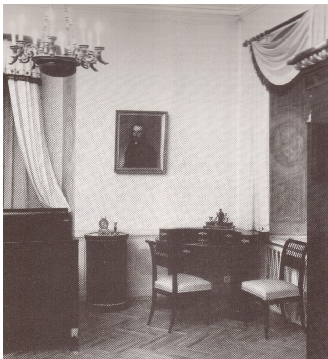
10. kép Tisza-kastély, klasszicista hálószoba, 1810

A 19. század elejéről való az a klasszicista stílusú éjjeliszekrény, melynek egyik példánya a Tisza-kastély hálószobájából való. 61 (10-11. kép)