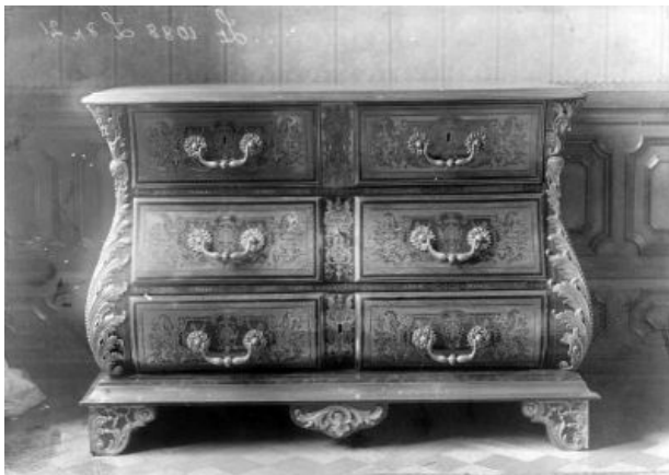
31. kép Iparművészeti Múzeum, fotó a Batthyány-Palota komódjáról, a fotó 1900 körül készült

Barokk komód fotóját őrzi az Iparművészeti Múzeum, amely a Batthyány-Palota nagyszalonjának bútordarabjáról készült. 80 (31. kép)