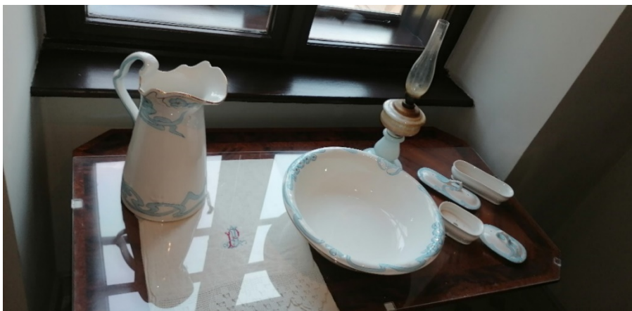
28. kép Gyulai Almásy-kastélyban a komorna szobája, mosdóasztal, a 19. század 2. felét reprezentálja

A gödöllői Grassalkovich-kastélyban láthatjuk kiállítva azt a mosdószekrényt, amelyet „tükrös komód Erzsébet királyné tulajdonából” felirattal láttak el. (29. kép) Ez a típusú mosdószekrény a 19. század közepéről már eredetileg nagytükrrel készült, míg az eddig látottakhoz külön tükröt helyeztek el a mosdóasztal környezetében, például a falon, ha arra igény volt.