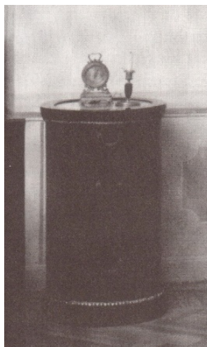
11. kép Tisza-kastély, klasszicista kerek éjjeliszekrény, 1810

Ahogy az ágyaknál is, úgy az éjjeliszekrények esetében is a 19. század második felét reprezentálja a kastélymúzeumok közül a gyulai Almásy-kastély neorokokó faragott diófa éjjeliszekrénye a női lakosztály hálójában. 62 (7. kép) Ugyanezen kiállítás férfi hálójában látható éjjeliszekrény a neoreneszánsz példáját hivatott bemutatni. 63 (8. kép)