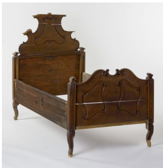
2. kép Iparművészeti Múzeum, barokk-rokokó ágy, Magyarország, 18. század

A 2. képen látható, az Iparművészeti Múzeum gyűjteményében található ágy készítési és használati ideje a 18. századra tehető. Az egykor feltehetőleg nemesi használatban lévő, tölgyfából készült darab íves lábai a késő barokk jegyeit, míg a végtámlák vonalvezetései már a rokokó jegyeit hordozzák. 50