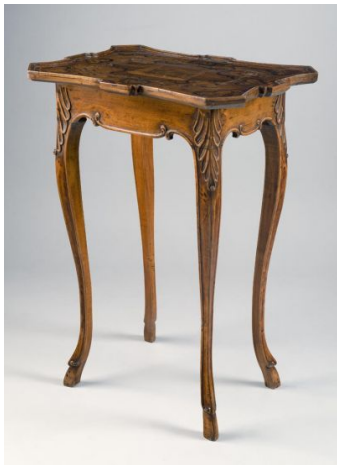
23. kép Iparművészeti Múzeum, kisasztal, Ausztria, 18. század közepe

Az Iparművészeti Múzeum gyűjteményében is találhatunk példákat. A 18. század közepének remekei a 23-24. képen látható kisasztalok. 71