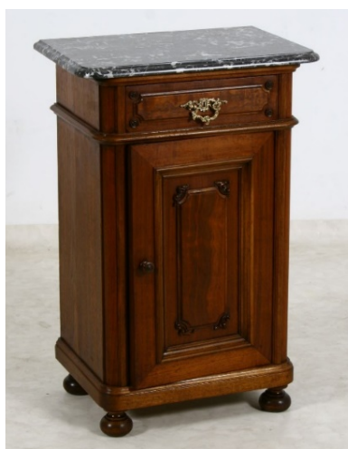
12. kép Mádi Wiedermann-ház, historizáló éjjeliszekrény, 1870 körül

Gyakori jellemző volt, hogy az éjjeliszekrények tetejét márványlap borította. Erre példa egy 1870-es években készült, historizáló darab a Szabadtéri Néprajzi Múzeumból, amely a mádi Wiedermann-házból, nemesi kúriából származik. 64 (12. kép)