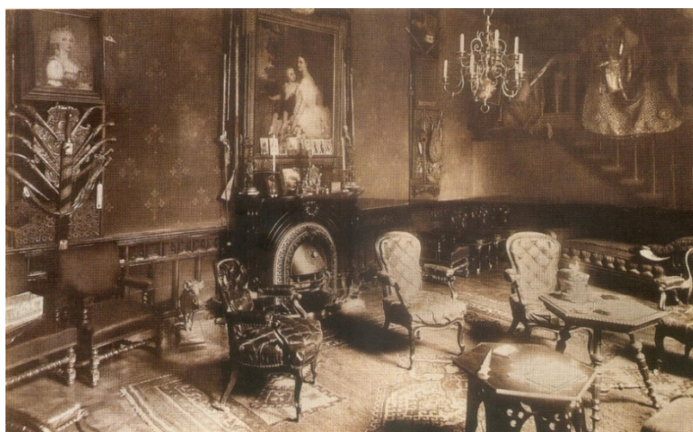
18. kép Parnói Andrassy-kastély szalonja, Klösz György felvétele, 19. század 2. fele

A parnói Andrassy-kastély eredeti, archív felvétele a 19. század második felében készült, ahol a szalonban, a fotó jobb oldalán a háttérben egy barokk jellegű, tűzött pihenőágyat, nyugágyat láthatunk. 69