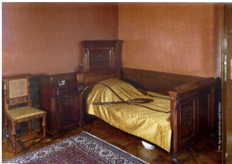
8. kép Gyulai Almásy-kastély férfi lakosztályának hálója, neoreneszánsz berendezés, 19. század 2. fele