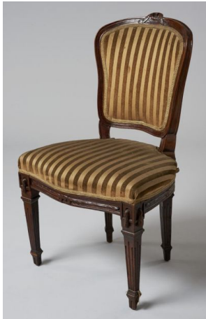
51. kép Iparművészeti Múzeum, klasszicista hatású szék, Magyarország, 18. század vége

A 18. század végén a klasszicizmus hatása jól látszik a következő, bársonnyal bevont példán, ami „kannelúrozott hasábos láb”-akon áll. 100 (51. kép)