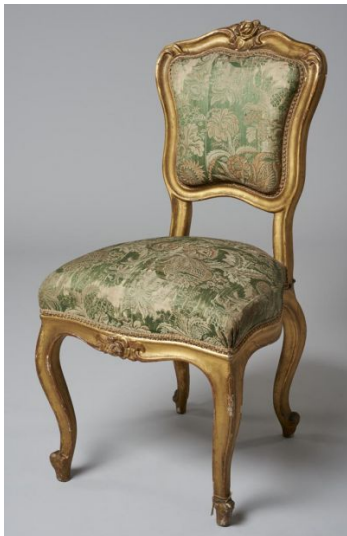
50. kép Iparművészeti Múzeum, Ráth-villa atlaszselyemmel bevont széke, 18. század 2. fele

A Ráth-villa egykori berendezéséből jó példa az atlaszselyemmel bevont szék, amit szintén az Iparművészeti Múzeum őriz a 18. század második feléből. 99 (50. kép)