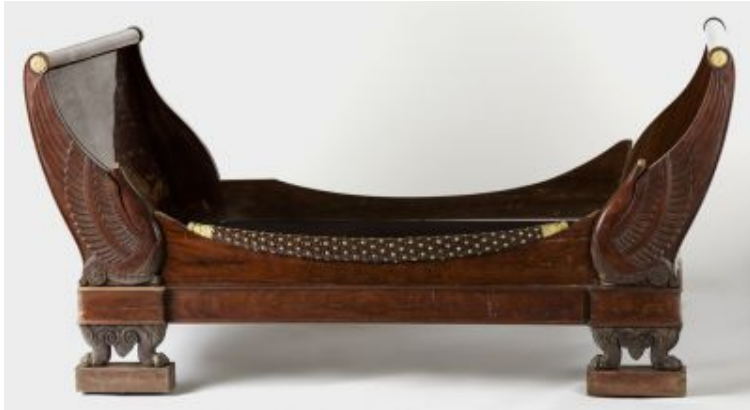
6. kép Iparművészeti Múzeum, empire ágy, Párizs, 1802-1806

A 19. század elején az Iparművészeti Múzeum gyűjteményében megtalálható, Jacob testvérek készítette, hajó formájú, hattyúnyakkal díszített mahagóni ágya, amely a francia empire stílust képviseli (1802-1806). 55 (6. kép)