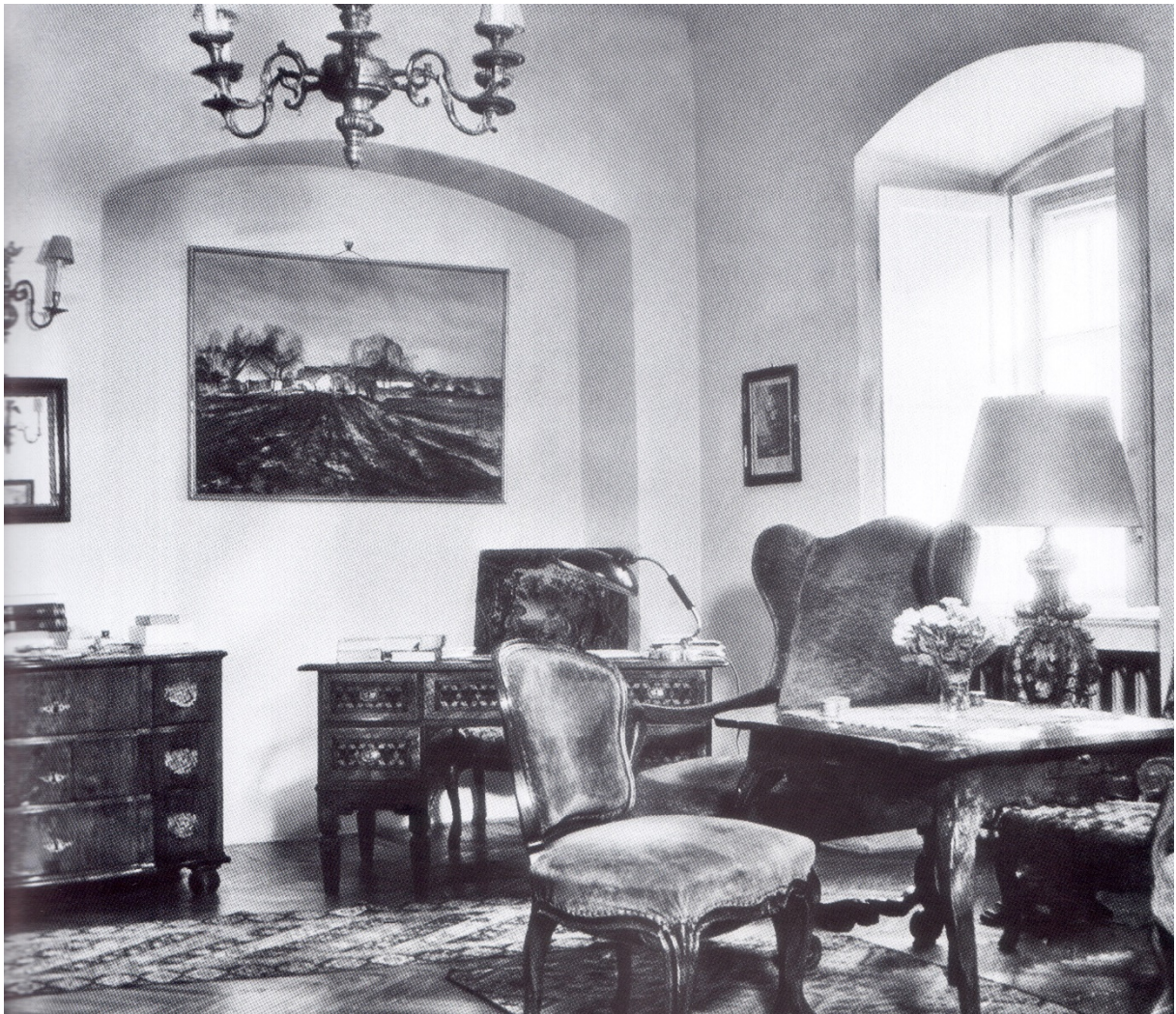
36. kép Zwack Jánosné háza, Budapest, Úri utca 45., fotó: a 20. század első fele

elhelyezett komódok extra szépségétől szerényebb. Mégis ez a későbarokk komód saját stílusában, egyszerűségében gyönyörű. 86 (36. kép)