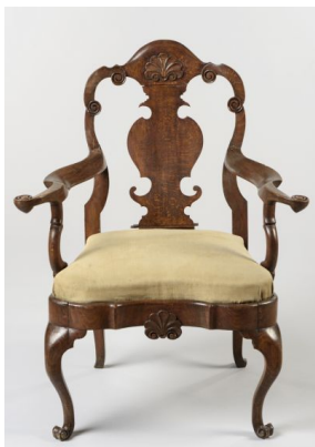
46. kép Iparművészeti Múzeum, hegedű formájú háttámlás szék, Nagyszében, 18. század közepe

18. század végén az ülőbútorok formavilágát, díszítettségét tekintve Vadászi Erzsébet a még felbukkanó rokokó hagyomány stílusjegyeit így foglalja össze: a csigás, enyhén ívelő kartámla őrzi már csak a rokokó hagyományt. Ezzel ellentétben ugyanezen ülőbútor szabályos formája, egyenes támlája, az ülőlap alatt négyzetbe foglalt rozettája, a vájatolt lába már XVI. Lajos stílusára jellemző, amely a barokk és a rokokó után, de még a klasszicizmus előtt a közép-európai copf-stílusnak felel meg. 95 (47. kép)