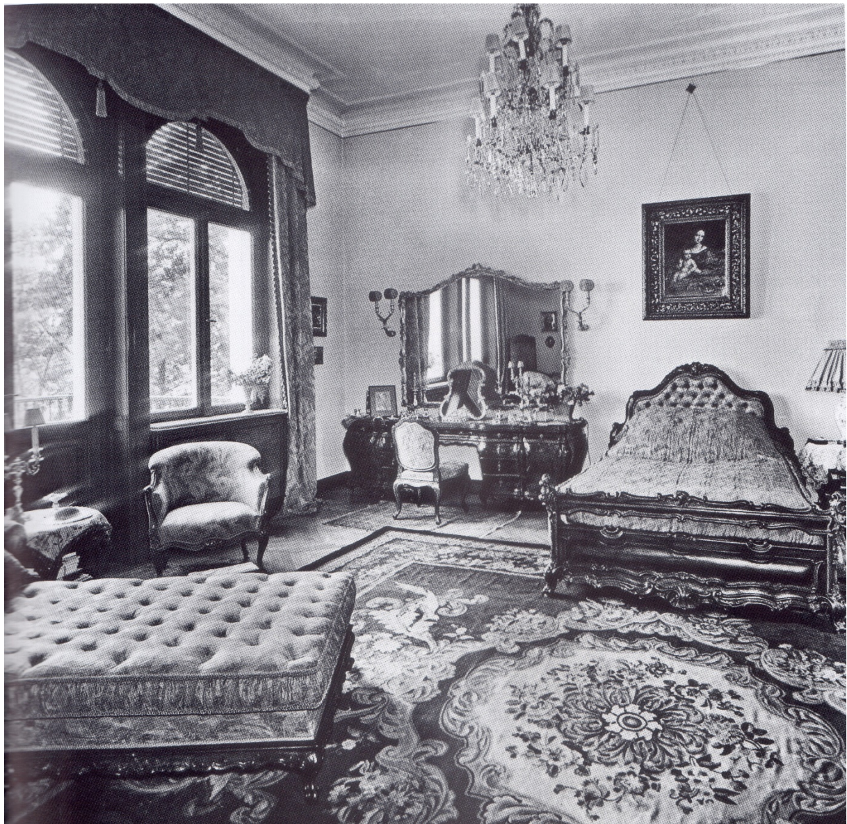
21. kép Kuper Hornerné villája, Budapest, Kelenhegyi út 27., fotó: a 20. század első fele

a múltat. Az említett épületek egy része még megvan, de az egykor lefotózott belső terek, bútorok már nincsenek. A kötet két példája nagyszerűen mutatja a hálószobákban elhelyezett nyugágyak jelentőségét. Fontos itt megjegyezni, hogy mindkét hálószoba barokk jellegű enteriőrjét Falus Elek tervezte, aki a 20. század első felében a polgári körök közkedvelt lakberendezője volt. 70 (21-22. kép)