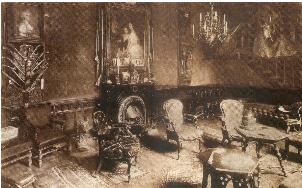
56. kép Parnói Andrassy-kastély szalonja, Klösz György felvétele, 19. század 2. fele

A 19-20. század fordulóján készített fotót Klösz György a parnói Andrassy-kastély szalonjáról, amelyen jól látszik a múlthoz való ragaszkodás, az arisztokrácia stílusértékelése. Míg a fotó közepén barokk tűzött karszékeket láthatunk, addig a fal mellé, a fotó bal oldalán reneszánsz jellegű karszékek vannak állítva. 104 (56. kép)