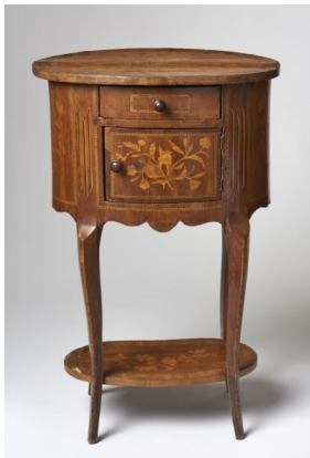
14. kép Iparművészeti Múzeum, éjjeliszekrény, 19. század vége

Szintén az Iparművészeti Múzeum gyűjteményében található az a 19. századvégi eklektikus éjjeliszekrény, mely ovális keresztmetszetű, kannelúrás és virág berakásos díszítésű, kihajló kecses lábakkal. 66 (14. kép)