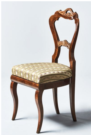
52. kép Iparművészeti Múzeum, historizáló szék, Magyarország, 19. század 2. fele

A 19. század közepén, egy 1846-os nagykárolyi kastélyinventárium adatai alapján Fazekas Rózsa közli, hogy „A grófi hálószoba ülőgarnitúráját kékes tarka, a grófnőét kékes alapon fehér rózsavirágos angol gyolcs borította.” 101 E korszak, a 19. század közepének példái az Iparművészeti Múzeum gyűjteményéből az 52-53. képen láthatóak. 102