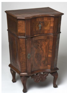
9. kép Iparművészeti Múzeum, éjjeliszekrény, Ausztria, 18. század közepe

Az Iparművészeti Múzeum gyűjteményében található a 18. század közepére datált éjjeliszekrényt, amely a barokk stílusjegyeit hordozza. 60 (9. kép)