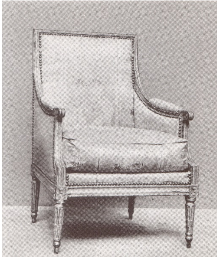
47. kép Ponce Gérard karosszék, Budapest, 1780

Magyarországon a 18. század végén megjelenő koraklasszicista bútorművészet ülőbútorai már ovális támlájú székek, melyek nádazottak, illetve faragott keretszegélyűek. 96 A faragott keretszegélyes székekre szintén két példa az Iparművészeti Múzeumból a 48-49. képen látható. 97