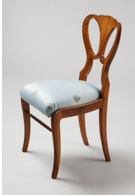
53. kép Iparművészeti Múzeum, historizáló szék, Magyarország, 19. század 2. fele

A 19. század második felének jellegzetes ülőalkalmatosságai már piskóta formájú, faragott ülőgarnitúrák, melyek szeszélyes vonalvezetésűek, ülőlapjuk alacsonyabban van, háttámlájuk azonban magasabb, miközben „hiányzik belőlük a rokokó könnyedsége” – írja Vadászi Erzsébet. Az egyszerűbb darabokon kávébarna, bordó, kék vagy sötétzöld ripsz vagy bársony kárpitokkal, míg a gazdagabbak színes selyemdamasztal vannak behúzva. 103