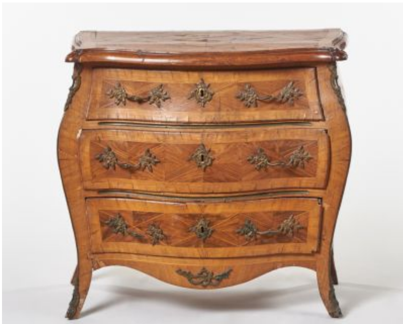
35. kép Iparművészeti Múzeum, komód, Közép-Európa, 19. század 2. fele

A komódok felsorakoztatása végén álljon itt egy olyan fotó, amely a 20. század első feléből való egy olyan házból, ahol a régi bútorok különösen nagy becsben voltak. A dolgozószoba komódja, amelynek csak 2/3-a látható a fotón, jól mutatja, hogy a szalonban