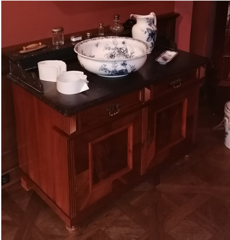
27. kép Gyulai Almásy-kastély férfi hálószobája, mosdószekrény, a 19. század 2. felét reprezentálja