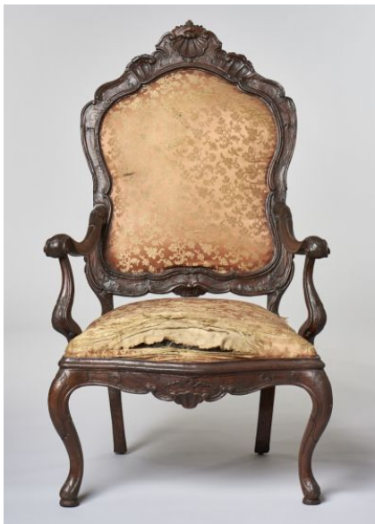
41. kép Iparművészeti Múzeum, hajlított patás lábú szék, Velence, 18. század közepe

A 18. század közepéről gyönyörű székeket őriz az Iparművészeti Múzeum, melyek közül itt három példát mutatok be. 93 (42-44. kép)