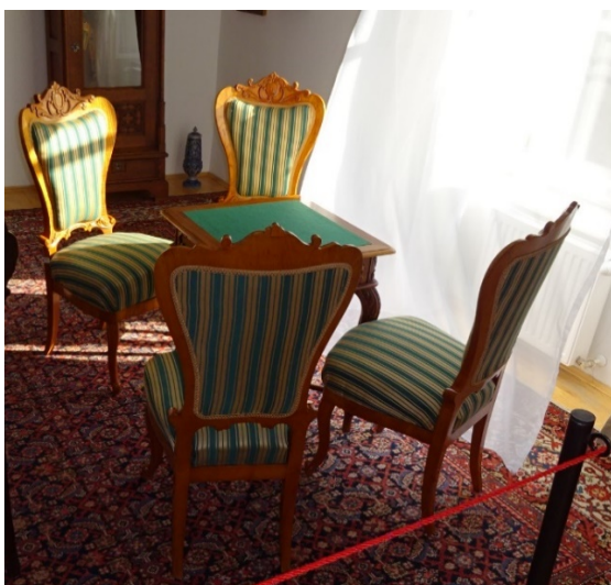
60. kép Baktalórántházi Dégenfeld kastélymúzeum, férfi szalon, 19-20. század fordulóját reprezentálja