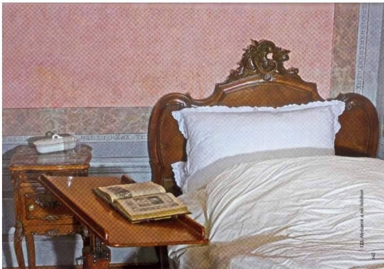
7. kép Gyulai Almásy-kastély női lakosztályának hálója, neorokokó berendezés, 19. század 2. fele

A 19. század második felét reprezentálja a kastélymúzeumok közül a gyulai Almásy-kastély neorokokó, faragott diófa ágya a női lakosztály hálójában. 56 (7. kép) Ugyanezen kiállítás férfi hálója a neoreneszánsz példáját hivatott bemutatni. 57 (8. kép)