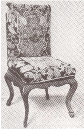
40. kép Regéci kastély, hajlított patás lábú szék, 18. század közepe

kárpitok. Az egyszerűbb, geometrikus díszítőmotívumokat felcserélik lombdíszes, jelenetes, kézzel varrott kárpitokkal.” 92 (40-41. kép)