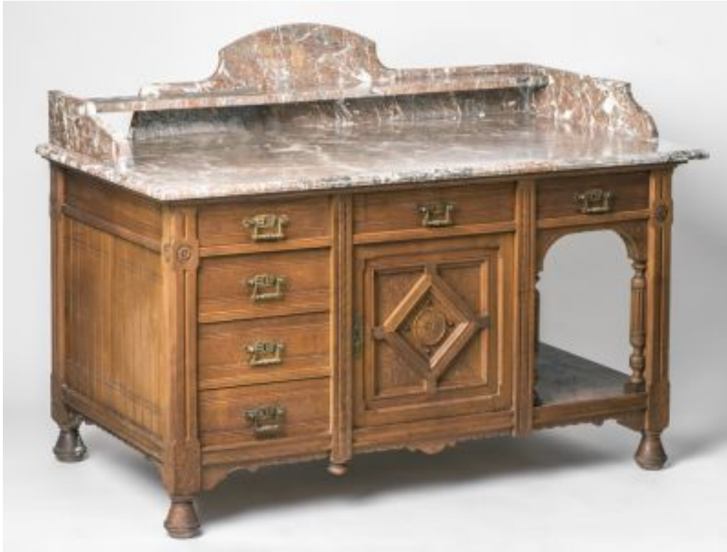
26. kép Iparművészeti Múzeum, mosdószekrény, Thék Endre Bútorgyára, 1888

A 19. század második feléről, 1888-ból, szintén a historizmus időszakából az Iparművészeti Múzeum is őriz mosdószekrényt, amely „egy úriszoba berendezésének része”. A nevezetes mosdószekrényt Thék Endre Bútorgyárában készítették Budapesten. 75 (26. kép)