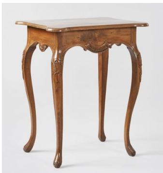
24. kép Iparművészeti Múzeum, diófa kisasztal, Magyarország, 18. század közepe