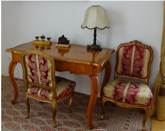
58. kép Baktalórántházi Dégenfeld kastélymúzeum, női szalon, 19-20. század fordulóját reprezentálja