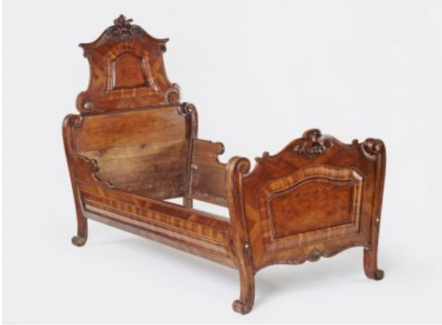
3. kép Iparművészeti Múzeum, rokokó ágy, Ausztria, 18. század 2. fele

Az egyszerű, 1713-as faragott támlás ágy és a barokk-rokokó, tornyos fejkéű tölgyfaágy után lássunk egy egykor minden bizonnyal főnemesi kastélyban szolgáló darabot. (3. kép) Az Iparművészeti Múzeum gyűjteményében található, a 18. század második felére tehető diófa ágy leírásában találhatjuk, hogy „fényezett”, tehát politúrozott. 51 Az ágy a késő barokk, illetve a rokokó csigás végdíszítéseit mutatja, amelyek valóban a 18. század második felére tehetők. 52