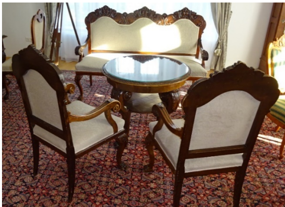
59. kép Baktalórántházi Dégenfeld kastélymúzeum, férfi szalon, 19-20. század fordulóját reprezentálja