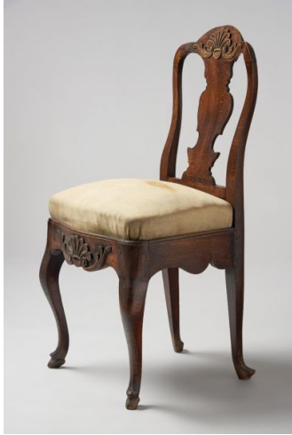
49. kép Iparművészeti Múzeum, faragott keretszegélyű szék, Nagyszeben környéke, 18. század 2. fele