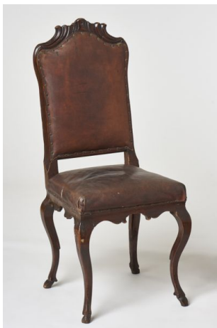
44. kép Iparművészeti Múzeum, barokk stílusú szék, Hont megye, 18. század közepe

43. kép - https://gyujtemeny.imm.hu/gyujtemeny/szek/35436?f=dwqpfwQS7bnVxFuZkvfuFUJtfZQzOr5-ab1S6BX2OpCu6HxoC7xdx8Goh7H7C3xdx8OtHdEpN7H7BXxdx8yrBkws5AKqx8Y&n=464 Letöltve: 2023.01.28.