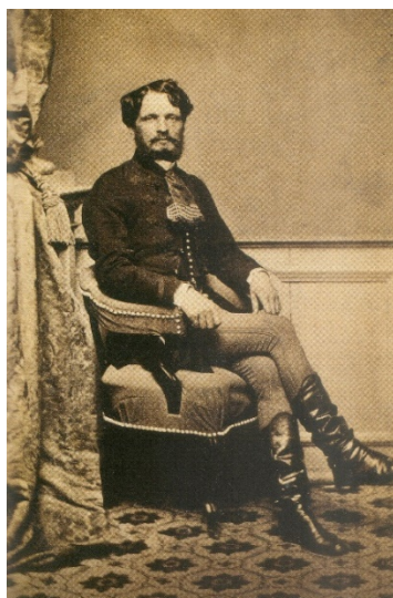
38. kép Andrassy Gyulát ábrázoló fotó, Simonyi Antal felvétele, 1860 körül

Ugyanezt a ragaszkodást, a múlt tiszteletét láthatjuk Andrassy Gyula 1860 körüli és Andrassy Manóné Pálffy Gabriella 1865 körüli fényképén, hiszen mindkét ülőalkalmatosság barokk jellegzetességeket mutat. 88 (38-39. kép)