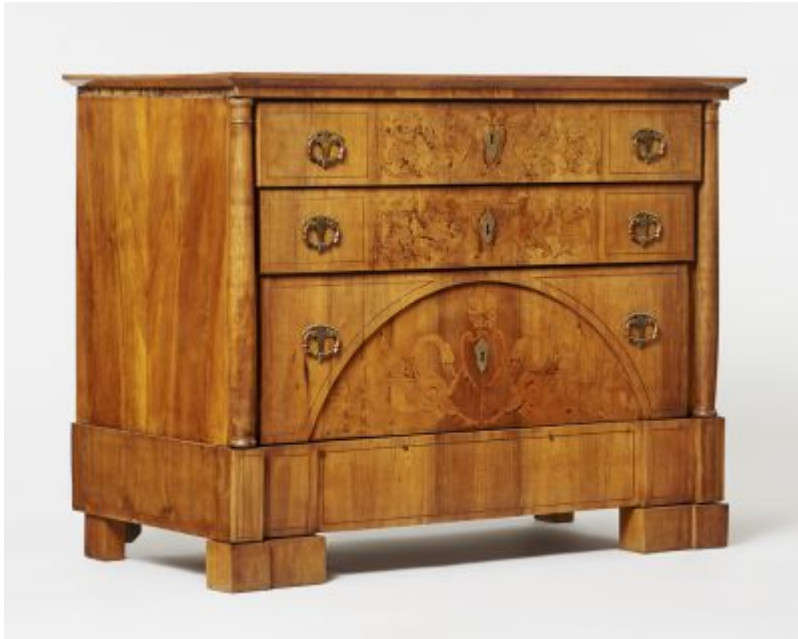
34. kép Iparművészeti Múzeum, komód, Magyarország, 19. század eleje