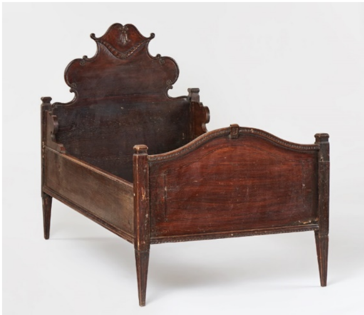
5. kép Iparművészeti Múzeum, polgári gyermekágy, Magyarország, 18. század vége

Stílusában a legutóbbi példához hasonlít – rokokó vonalvezetésű a támladísztésekkel és a klasszicista vékonyodó lábakkal – az Iparművészeti múzeum koraklasszicista gyermekágya a 18. század végéről. 54 (5. kép)