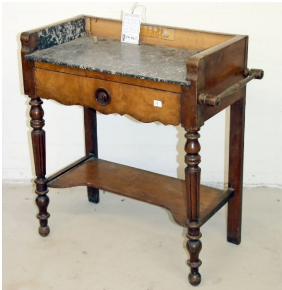
25. kép Szabadtéri Néprajzi Múzeum, mosdóasztal, Kecskemét, 19. század 2. fele

A Szabadtéri Néprajzi Múzeum gyűjteményét gazdagítja az a 19. század második felében készült, historizáló darab, amely törülközőtartós, márványlapos, egy fiókos, egyszerűbb kivitel. 74 (25. kép)