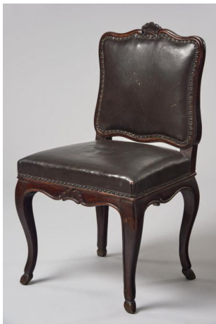
43. kép Iparművészeti Múzeum, barokk stílusú szék, Magyarország, 18. század közepe