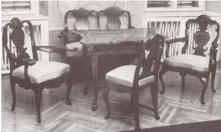
45. kép Nagytétényi kastélymúzeum, Ülőgarnitúra, Nagyszében, 18. század közepe

Szintén a 18. század közepén jelennek meg az áttört, hegedű formájú, kagylódíszes háttámlák, a finoman hajlított vonalú, csigás kialakítású kartámlákkal. 94 (45-46. kép)