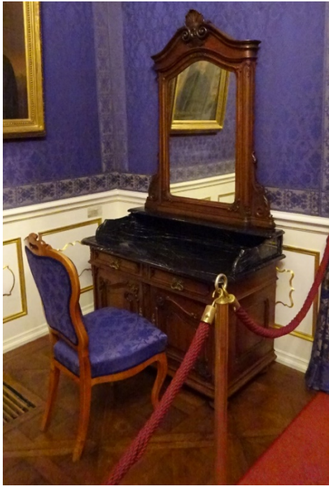
29. kép Gödöllői Grassalkovich-kastély, Erzsébet királyné tükrös komódja, 19. század 2. fele

Egy 1911-es, ismeretlen tulajdonában lévő hálószoba fotóján is láthatjuk a szekrények között elhelyezett mosdótálat és kancsót, a szépen rendezett, historizáló szobabelsőben. Feltehetőleg ezek a darabok még funkciójuk szerint szolgáltak, nem pedig díszként helyezték el azokat. 77 (30. kép)