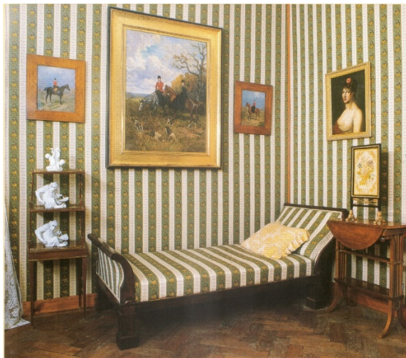
15. kép Betléri Andrassy-kastély, empire szalon, 19. század 2. felét reprezentálja

Későbbi empire példájára bukkanhatunk a betléri Andrassy-kastélyban, ahol a bútor szövete megegyezik a fal borításával, annak érdekében, hogy harmonizáljanak egymással. (15. kép) Ugyanitt láthatunk egy biedermeier szalont pihenőágygal. 68 (16. kép)