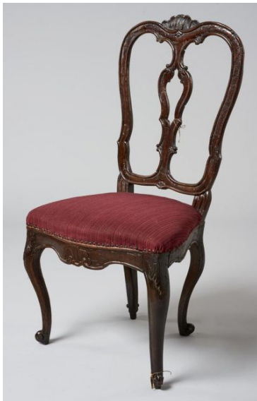
48. kép Iparművészeti Múzeum, faragott keretszegélyű szék, Velence, 18. század 2. fele

Magyarországon a 18. század végén megjelenő koraklasszicista bútorművészet ülőbútorai már ovális támlájú székek, melyek nádazottak, illetve faragott keretszegélyűek. 96 A faragott keretszegélyes székekre szintén két példa az Iparművészeti Múzeumból a 48-49. képen látható. 97