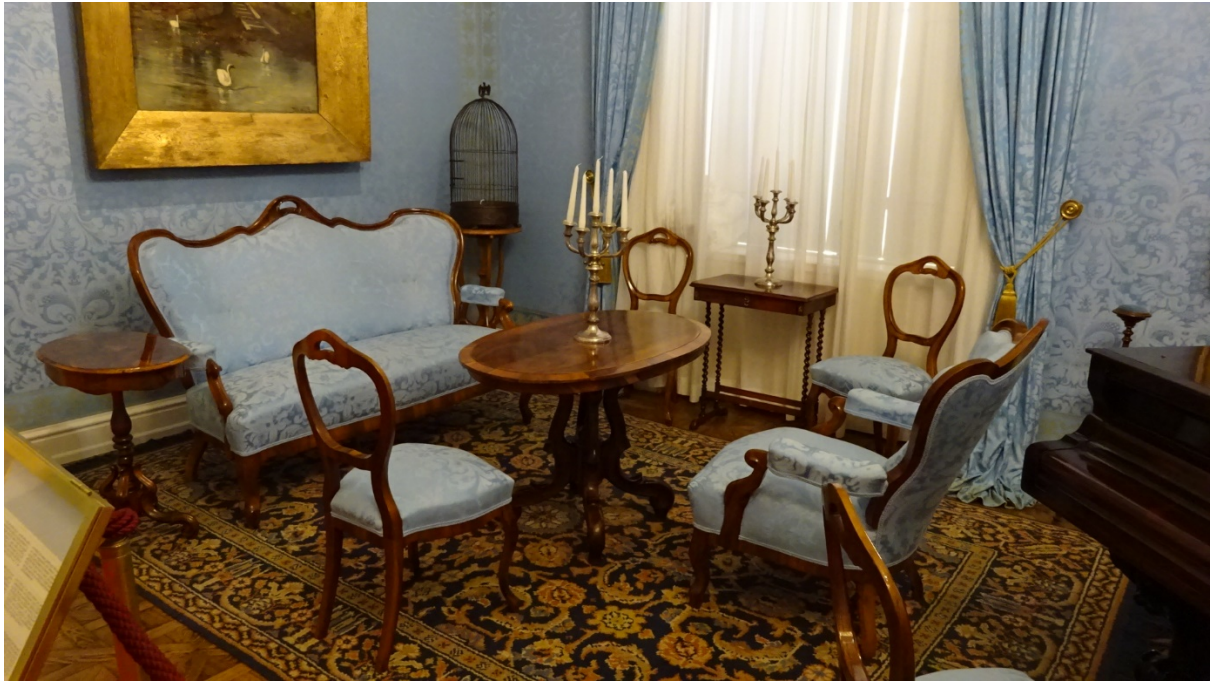
55. kép Gödöllői Grassalkovich-kastély, Mária Valéria szalonja, 19. század 2. fele

A 19-20. század fordulóján készített fotót Klösz György a parnói Andrassy-kastély szalonjáról, amelyen jól látszik a múlthoz való ragaszkodás, az arisztokrácia stílusértékelése. Míg a fotó közepén barokk tűzött karszékeket láthatunk, addig a fal mellé, a fotó bal oldalán reneszánsz jellegű karszékek vannak állítva. 104 (56. kép)