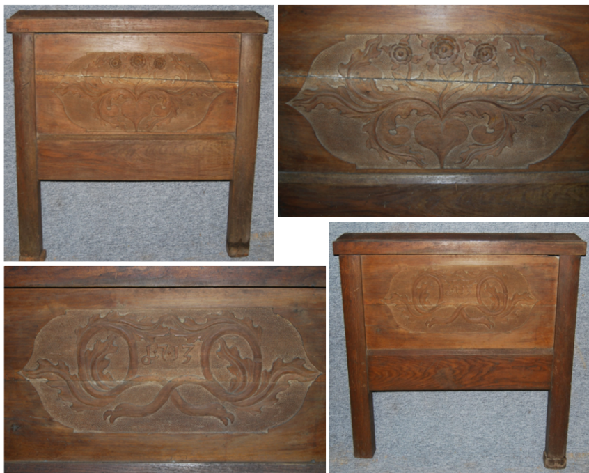
1. kép Magyar Néprajzi Múzeum, támlás ágy ágyvégei, Sopronkeresztúr, 1713.

A 2. képen látható, az Iparművészeti Múzeum gyűjteményében található ágy készítési és használati ideje a 18. századra tehető. Az egykor feltehetőleg nemesi használatban lévő, tölgyfából készült darab íves lábai a késő barokk jegyeit, míg a végtámlák vonalvezetései már a rokokó jegyeit hordozzák. 50