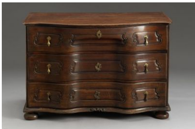
33. kép Iparművészeti Múzeum, komód, Magyarország, 18. század 2. feléből

Természetesen az Iparművészeti Múzeum többféle stílusú komódot őriz az elmúlt századokból. A 18. század második feléből egy Magyarországon készített bronz veretes, diófa komódot emelek ki, mely egyszerűségében gyönyörű. (33. kép) Feltehetőleg nem szalonba való komód, talán inkább éppen vendégszobába. 83 A következő a 19. század elejéről egy diófa borítású, berakásos komód, amely az előzőtől több szempontból is teljesen eltér. 84 (34. kép) Az utolsó példám pedig a 19. század második feléből való, Közép-Európából, a historizmus korából. 85 (35. kép)