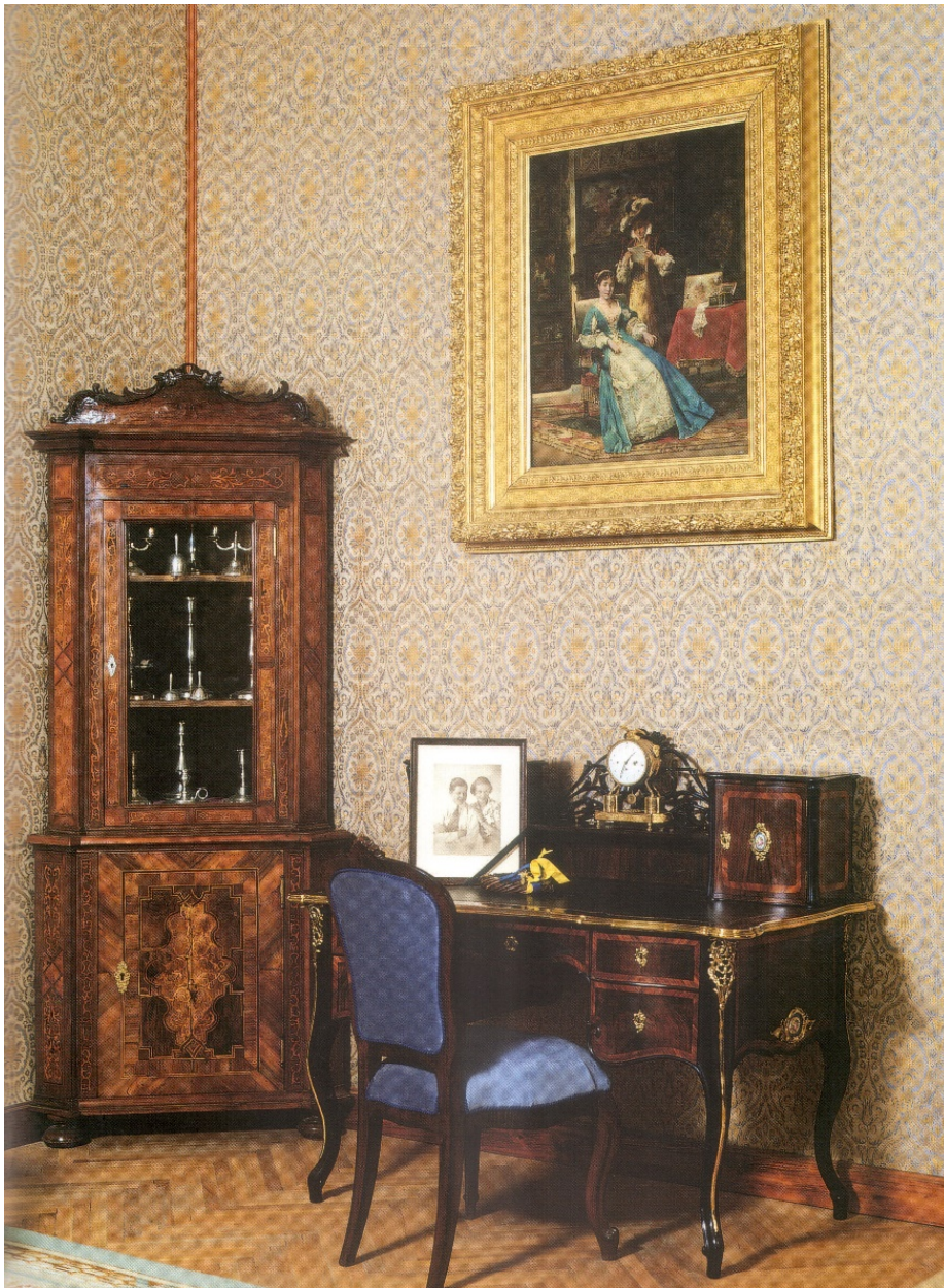
57. kép Betléri Andrassy-kastély kiállítása, historizáló szoba, 19. század 2. fele

A betléri Andrassy-kastély kiállításában, egy „historizáló szobabelsőben” két kárpítozású neobarokk szék látható. 105 (57. kép)